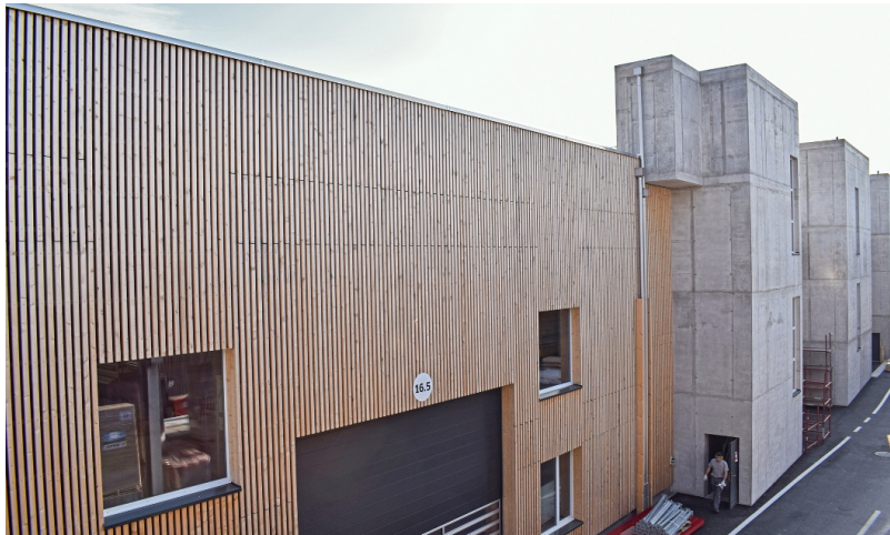
Hallenbau in beachtlichen Dimensionen